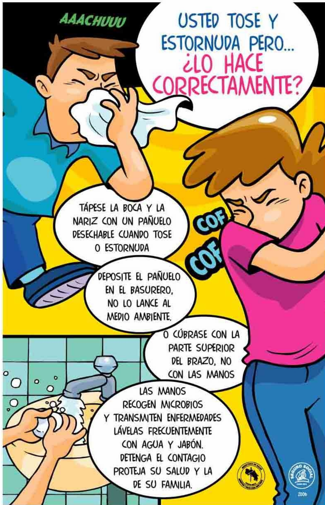
Caja Costarricense de Seguro Social. Cartel accesible en http://www.ccss.sa.cr/avisos/doc-avisos/Afiche-toser-estornudar.JPG