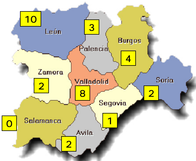
Victimas de accidentes de trabajo mortales en puesto de trabajo en Castilla y León.