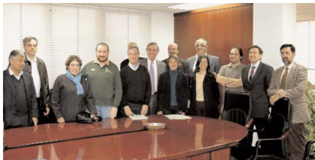
Asistentes a la firma de Convenios de la UNED

la situación general en la que estamos, podemos beneficiarnos de unas mejoras a cuenta del Convenio. El 1,5% conseguido, más dos pagas consolidables en nómina de 25.000 y 40.000 euros, suponen, sumadas a la subida anual aún por determinar, una mejora que sólo podemos valorar positivamente.