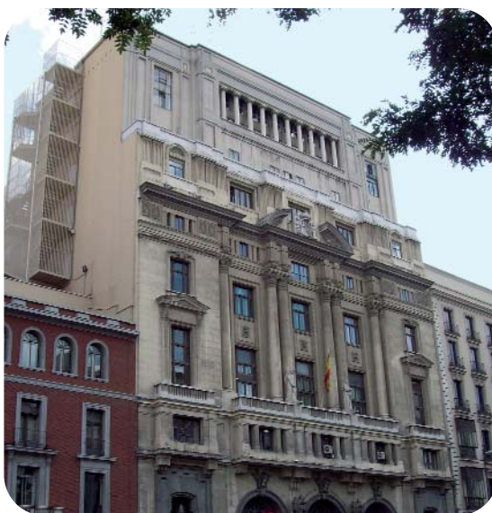
Ministerio de Educación

Para FETE-UGT es tema prioritario que no existan más demoras, que se aproveche lo positivo de la