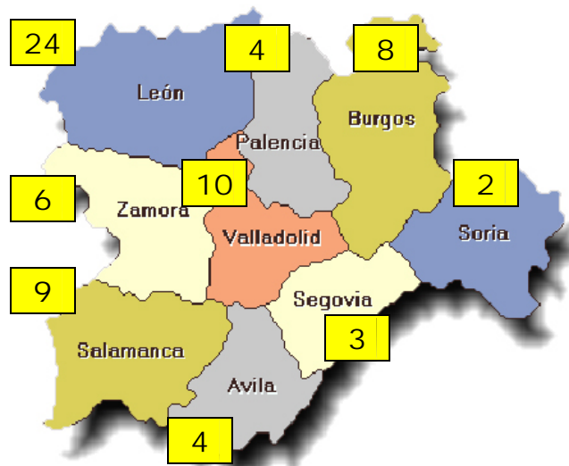
Víctimas de accidentes de trabajo mortales en puesto de trabajo en Castilla y León.