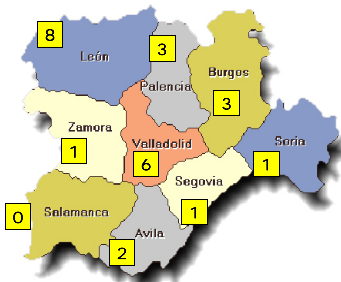
Victimas de accidentes de trabajo mortales en puesto de trabajo en Castilla y León. Origen de los datos: elaboración propia.