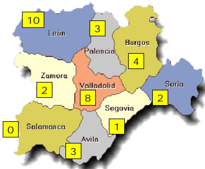
Victimas de accidentes de trabajo mortales en puesto de trabajo en Castilla y León. Origen de los datos: elaboración propia.