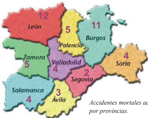
Accidentes mortales acumulados por provincias.