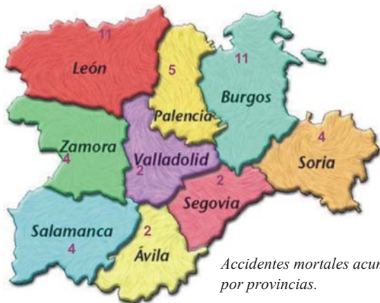
Accidentes mortales acumulados por provincias.