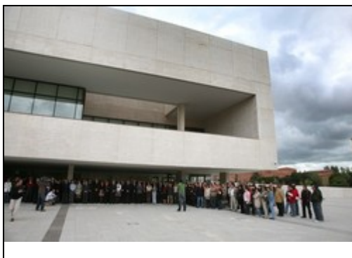
El presidente de la Junta, Juan Vicente Herrera, y el presidente de las Cortes, José Manuel Fernández Santiago, presiden la concentración en las Cortes en contra del atentado de ETA