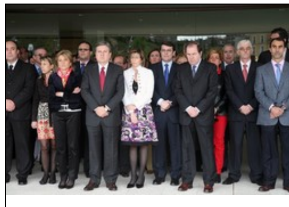
El presidente de la Junta, Juan Vicente Herrera, y el presidente de las Cortes, José Manuel Fernández Santiago, presiden la concentración en las Cortes en contra del atentado de ETA