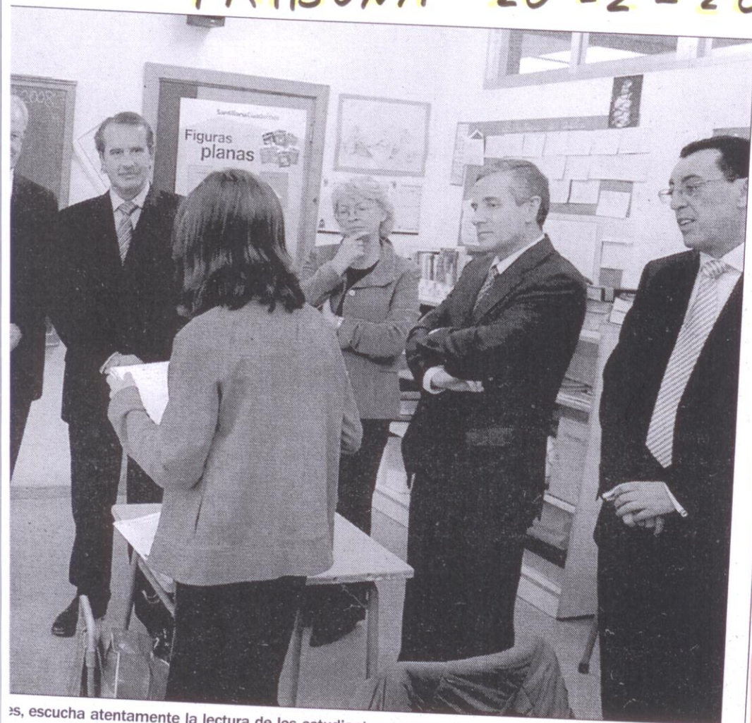
...es, escucha atentamente la lectura de los estudiantes

La propuesta de UGT para mejorar la calidad de la enseñanza pública actual se centra en la puesta en marcha de un sistema de desdobles o flexibilización de grupos en el contexto escolar ordinario.